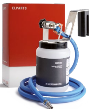
Sprühpistole, Klimaanlagenreiniger/-desinfizierer AirClean Artikelnummer: 95921003