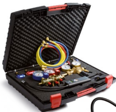
Lecksuche-Set, Klimaanlage SelectH2 Artikelnummer: 95980028

Die Klimaanlageenschutzverordnung ist zu beachten und die Vorschriften sind unbedingt einzuhalten. Neben gesundheitlichen Aspekten der Fahrzeuginsassen und der des Monteurs schont die sachgemäße Reparatur die Umwelt und den Geldbeutel! Nichtbeachtung kann mit einer Geldstrafe bis zu 50.000 Euro geahndet werden.