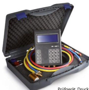
Prüfgerät, Druckverlust Artikelnummer: 95980026